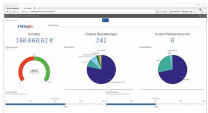
Abbildung 6: FRESHfin® und Qlik Business Intelligence